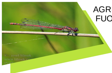
AGRION DI FUOCO

I sentieri si possono imboccare dalla Madonnetta - Raggiungibile da Gornate percorrendo Via Montello o seguendo le indicazioni Per Cascina Martina.